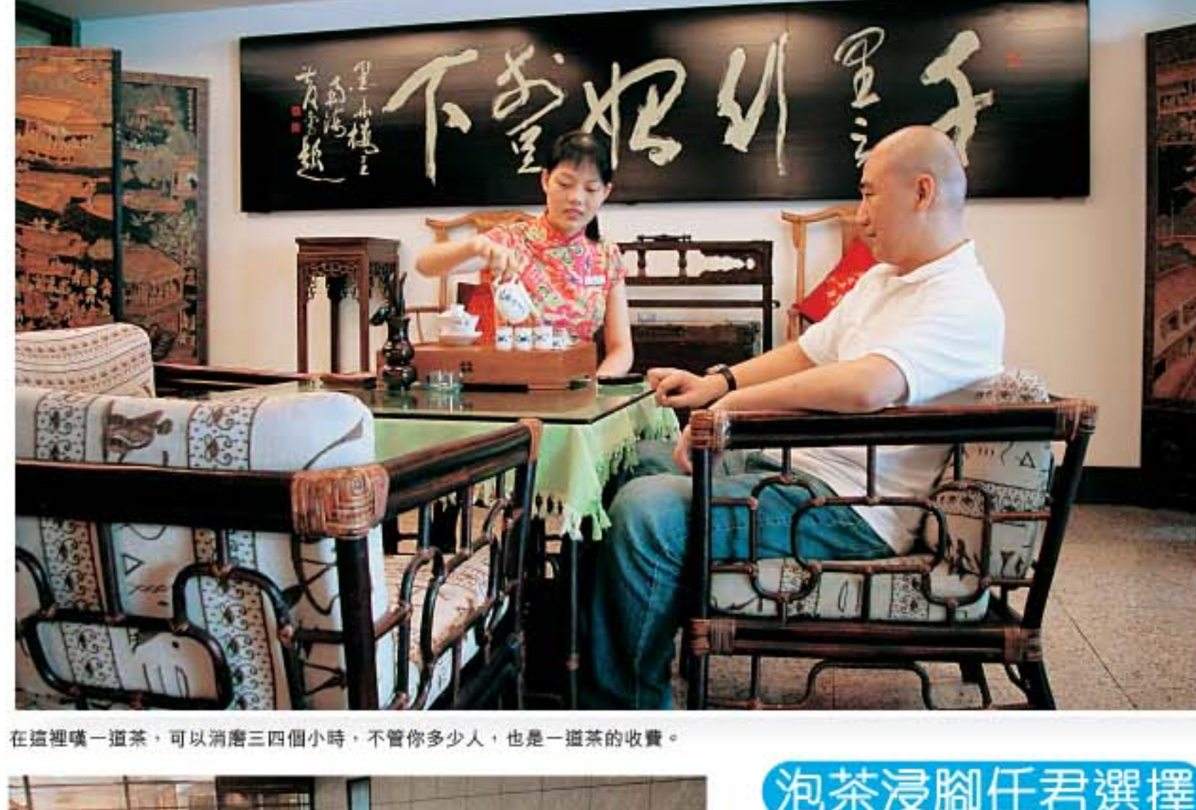
在這裡嘆一道茶，可以消磨三四個小時，不管你多少人，也是一道茶的收費。