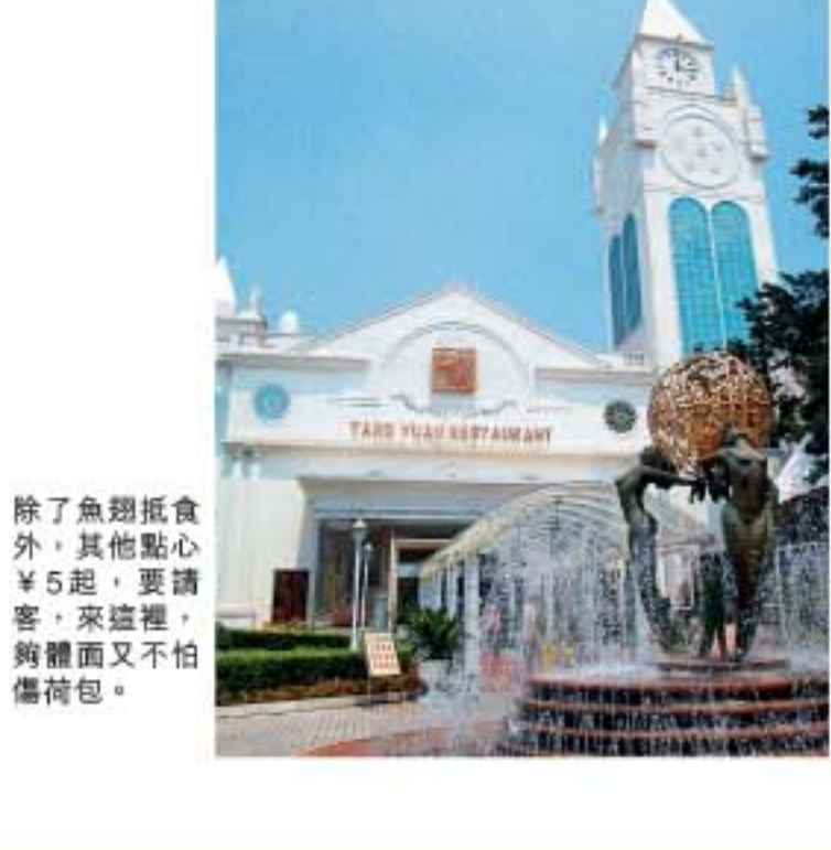
除了魚翅飯食外，其他點心¥5起，要請客，來這裡，夠體面又不怕傷荷包。

地址：人民北路流花湖公園北門 前往方法：地鐵紀念堂站，經過中國大酒店及東方賓館後走鐘道過人民北路。 電話：86-20-3623-6993 營業時間：每日8:00am-3:00pm, 5:00pm-10:00pm