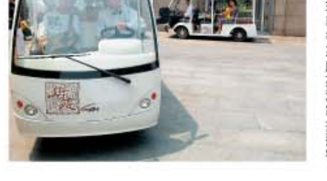
有高爾夫球車往來唐苑酒樓接送客。