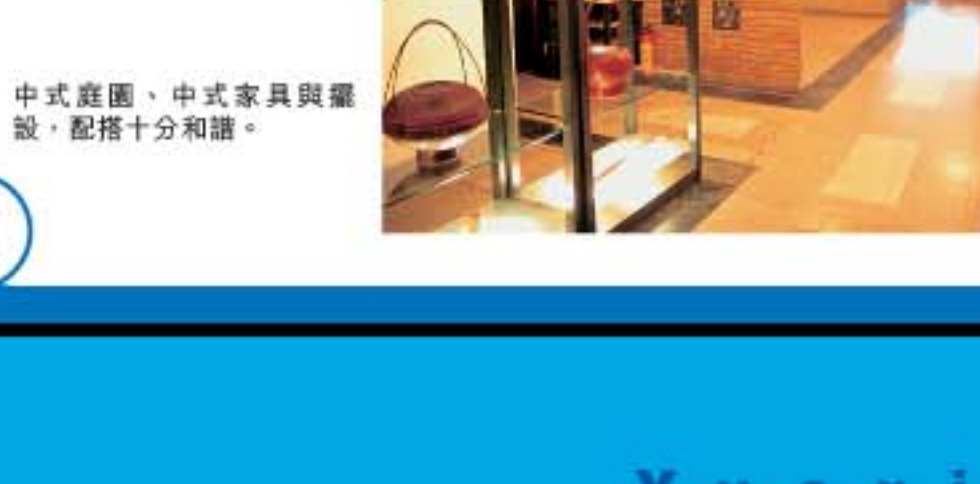
中式庭園、中式家具與擺設，配搭十分和諧。