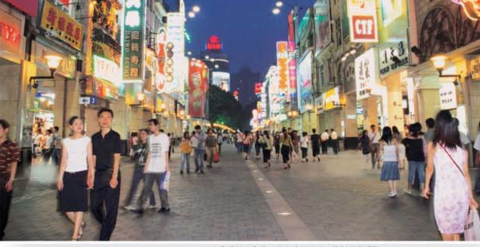
入夜後的北京路，遊人絡繹不絕，忙於逛街購物。