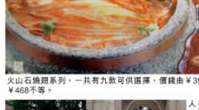
火山石燒翅系列，一共有九款可供選擇，價錢由¥39-¥468不等。

又名白宮酒樓，坐落於流花湖公園之內的流花湖邊。這間歐式外貌的中菜餐館，從外看是歐洲貴族式的精緻，裡面卻是百分百的中西金碧輝煌。以食魚翅聞名的唐苑，最近更有新噱頭「火山石燒翅系列」，是以石器時代的火山石造成石鼎，燒熱後盛魚翅，作為保溫上桌，感覺比以金鼎銀鼎上翅更豪更刁鑽。